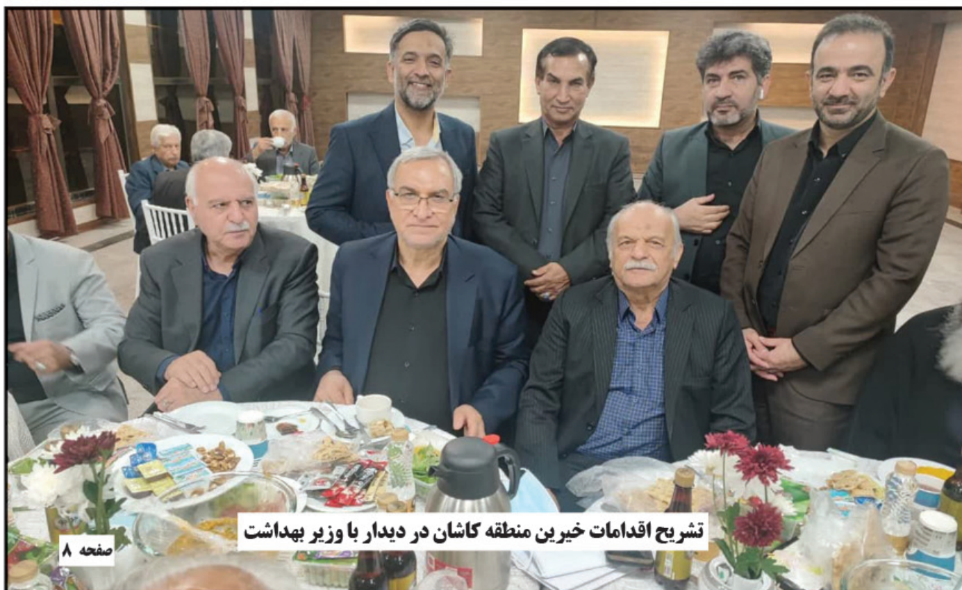
تشریح اقدامات خیرین منطقه کاشان در دیدار با وزیر بهداشت